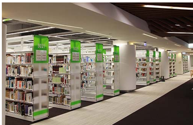
▲善用校園資源，如圖書館。儲備自己實力，打下穩健的基礎。

我們需要依靠語言來吸收前人經驗並傳承知識。對我們而言，以英文與中文最為重要。英文是目前國際通用語言，中文則是最多人口使用的語言，因此必須熟悉這兩種語言才能與世界接軌！