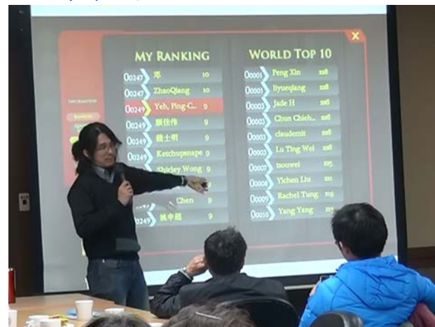
▲在 PaGamO 裡可以看到全世界解題排名，讓學生們瘋狂 online 算機率，不想下線。

生課業太重而減少作業量，導致同學平時練習機會較少。如此一來，部分學生平常都不主動念書，到了期中考或期末考前才臨時抱佛腳，應付考試，葉老師說：「這種教育模式訓練出的是一群危機處理的高手，危機一旦解決就全都忘得一乾二淨。」這非教育的本意。