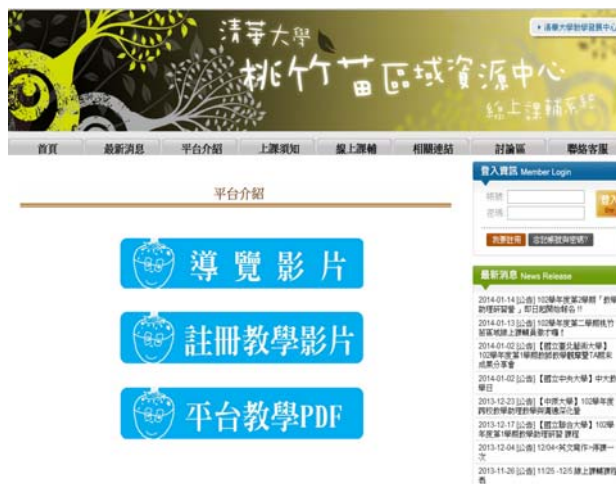
▲在平台上有提供本課輔系統的使用影片說明，讓你加入課輔無障礙。

目前線上課業輔導開設科目有微積分、英文會話、英文寫作和英檢中高級等科目，歡迎您帶著問題和愉快的心情進入平台一起討論吧！