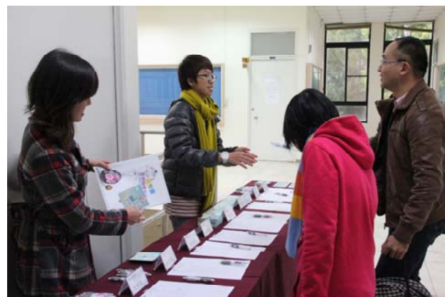
▲利用課餘時間參加社團活動，累積生活經驗，增加學習社會化的機會，添加大學生活色彩。

樣樣精通。老師建議先選一門最有興趣的課程，將它熟讀並融會貫通。一旦你學會精通學問的技巧後，就可善用至其他學習領域。