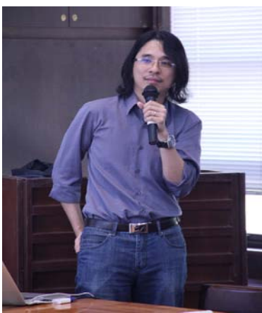
▲葉老師十分重視與學生的互動。除了課堂外，也花心思於經營社群網站關心學生。

葉老師的機率課不僅是第一批在大規模公開線上課程 Coursera 推出的華語課程之一，PaGamO（台語：打 Game 學）更是全球首次放上 MOOCs 的線上遊戲學習系統。PaGamO 模仿一般線上遊戲模式，要佔領土地也要打怪練級，唯一的差別是需靠自己動腦解題才能擴張勢力。且在遊戲過程中學生還能看到全球解題數的世界排名，這讓許多學生瘋狂解題不想下線。這種顛覆傳統的