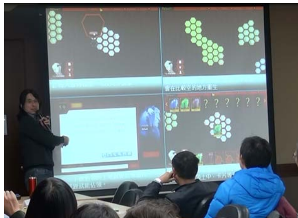
▲葉老師介紹團隊所設計的 PaGamO 的遊戲規則，透過解機率問題來佔地練級。

美國大學生每學期課程約十二到十五學分，每週都有作業，讓學生有充足時間複習。台灣學生每學期卻要修二十幾個學分，因為修課學分太多，老師們多體諒學