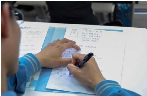
▲上課認真做筆記，消化吸收上課的內容，方能轉換成自己的知識。

高中以前課堂老師會提示重點、哪裡一定會考。但成為一個大學生，要學會自己作筆記、抓重點。當你能消化和濃縮課程內容成自己的筆記時，才算真正吸收知識。