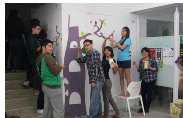
▲藉由彩繪學院交誼廳，打造屬於同學們自己的交流空間，也增加對學院的向心力。

我們歡迎對自己的未來有更深的期待、想要體驗不同學習方式的同學加入清華學院，為找到一個獨特的台灣高等教育方向共同努力。