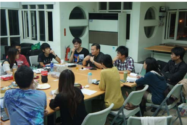
▲褪去老師的角色一起加入讀書會討論，開啟讀書會更多元的想法。

現今是個講求多元學習的時代，不能滿足於自己專業的領域學習嗎？勇敢的探索未知的知識世界吧！歡迎各位老師和同學多多參與本中心所舉辦的相關活動和計畫，意想不到的收穫在等著你喔！