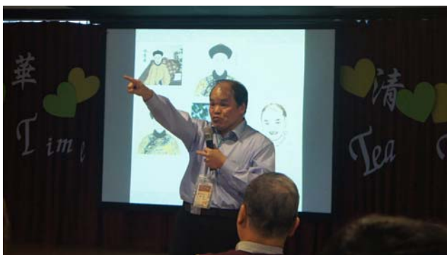
▲中研院院士黃一農教授，分享福康安與乾隆皇帝之關係，讓全場老師們津津樂道。

【文/徐文翎（特派記者）】深入探索自己的專業領域，雖可在教學研究或學習上精益求精，但時間久了，難免失去創新的靈感或想法！跨領域的交流，不僅是為了汲取各領域的知識，更為嚴肅的課業和教學研究注入一劑強心針，激發出令人驚艷的獨到見解。本中心辦理跨領域交流活動，分為教師和學生兩部分：教師部分，自 2013 年起，每月與老師們相約某一周五下午共享輕鬆「清華 Tea Time」時光；學生部分，則由同學自主組成讀書會，進行跨科系課外的學習。