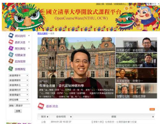
▲可利用本校開放式課程進行課業複習或預習，讓你一手掌握自己的學習步調。

語言能力與專業知識將是各位同學未來的依傍！中文對多數學生來說是母語，已具備基礎溝通能力。但英文相對來說需要花時間培養，必須聽說讀寫皆流利，才能在課業或職場上有所助益。至於專業知識方面，多數同學單一學期修課數過多而無法