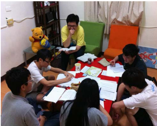
▲三五好友席地而坐，提出個人不同的觀點與看法，豐富讀書會的內容，並學習尊重他人想法的態度。