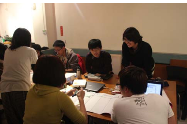
▲讀書會進行時設計些小活動，增加組員們的互動機會，也增添讀書會的趣味性。

動進行課外學習，本中心規畫「學生讀書會」補助方案，期待藉此提升同學自主學習的風氣，進而促進互動討論的共學成長。讀書會主題除了專業的「課程」及與研究相關的「lab」外，還有「社團」和「同好」等四大類別讀書會。同學們討論的主題相當多元，如繪圖軟體應用、國際時事探討及藝術分析等都是學校課程外的主題。讀書會由不同院系的同學自主組成，因此在相同的議題上，來自不同學院的同學各自提出其觀點，在討論互動的過程中，不自覺地獲取其它領域的想法，逐步學習成長，創造出不同以往的開闊見解。由各小組共同努力的期末成果報告中可見，雖然各讀書會的成員分屬於不同科系、不同專業背景，所以準備各自的讀書題材及撰寫心得報告時，也跳脫出屬於自己個人的思維，豐富了整個小組的知識收穫，並在聽取別人的報告以及彼此提問討論