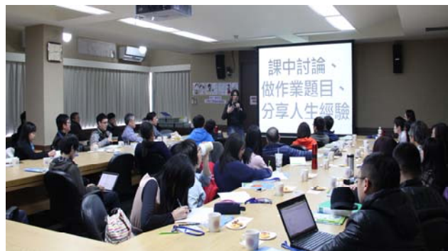
▲葉老師講解錄影傳授知識、上課討論問題的進行方式。精彩的演講，全場專注聽講。

傳統的授課方式因上課時間有限而無法讓老師們同時做到「傳道、授業、解惑」，然而翻轉教室卻可以一次滿足三個願望，因為授業的部分已變成線上資源，課堂上就有足夠的時間讓老師分享人生經驗，教導學生做人處事與做學問的道理，無須花費太多時