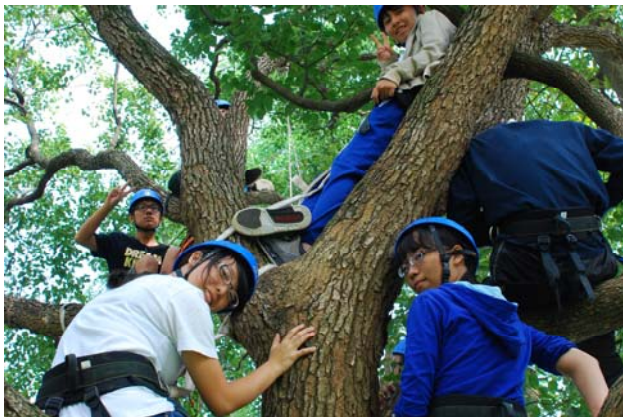
▲藉由攀樹、認識樹活動，來改變同學們的視野。學會用樹的高度來認識世界，改變心境。

我們觀察到許多學生對於系上的專業訓練總是缺少熱情，可能因為科系的選擇是聽從父母師長的期望、追隨社會的潮流風氣，或是學生不知如何想像自己的未來人生。因此學院主張在宿舍中建構一個學生交流的平台，讓學生可以進行情感聯繫，建立學習性組織，組成管理宿舍生活的自治組織，甚至到創發個人夢想與揪團行動。學生在學院中，被鼓勵擴大探索面向、去思考如何自我實踐，如何找到夥伴，以及如何發現專業訓練與夢想實踐的連結點。我們相信這樣的學習歷程，能讓學生對生活有感、對學習有