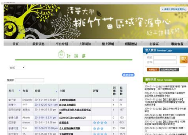
▲線上課業輔導提供討論區，於未開課時間仍可提問，課輔員不定時為你解答喔！

台灣學生學習英文方式，除平日課堂外，常見為透過英文教材或光碟學習，由於缺少互動，學生無法確定自行變化的句子是否正確，久而久之養成死背標準答案的學習