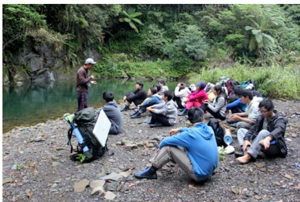
▲在教練的帶領下，擺脫對 3C 產品的依賴，練習在荒野中獨處。