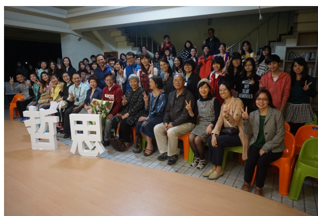
▲哲思廣場打造學生思考人生。

大學是學生尋找自我的關鍵，但能與師長探討人生、以人生為借鏡的機會卻很少，而哲思廣場就是期望打造一個讓學生思考人生的環境，不是一般課程的知識傳遞，而是有溫度的語言與觸動人心的故事。