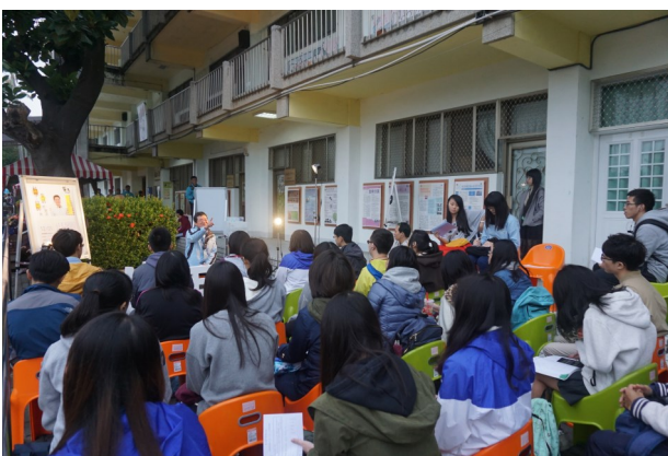
▲麵包樹下開啟學習之路。