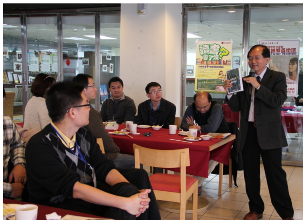
▲教務長於期末新進教師交流餐會以「師鐸清華」勉勵老師們追求教學精進。

不論是四部曲中的「新進教師研習營」、「M&M 計畫」、「新進教師工作坊」及「新進教師期末交流會」，都是本中心為新進教師們量身打造的活動，最終目的是希望給予新進教師們在本校教學、研究與生活的支援，為此，本中心會盡最大的努力提供各種教學相關的資源與管道，協助清大的新進教師們在清華的一切都能順心、如意，歡迎新進教師們多多利用四部曲囉~