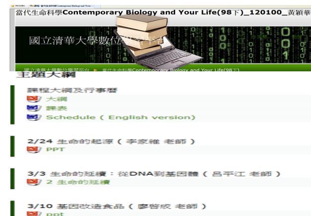
▲列出課堂的補充資料，方便師生隨時更新及下載。