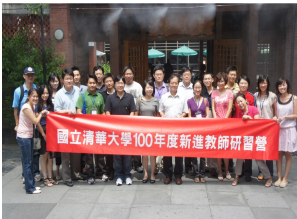
▲教務長十分關切新進教師們，在研習營中與老師們交流，以期早日融入清華大家族。

過去參與本研習營的新進教師們普遍反應熱烈且正面，認為研習營內容豐富，且獲得許多教學與研究資源的資訊，進而成為未來在清華校園教學與研究生涯規畫的參考，對於新進教師了解並融入清華校園環境十分有助益。