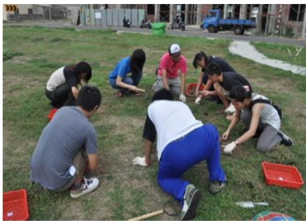
▲地貌探查與挖掘，透過現場針對遺物、現象之處理與記錄方式直接進行講解，培養學生應變能力也活化學生的考古知識，使其觸類旁通。

研討會、教材革新與蒐集、校(戶)外教學及教學軟體試用註冊等項目，每學期每門課補助上限額度為 1 萬元整。讓課程加入不同的新元素，呈現更多元且嶄新的面貌。