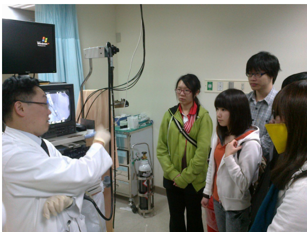
▲學生參訪馬偕紀念醫院新竹分院，透過理論與實務相結合，讓學生可以將知識有效的消化及吸收。

為鼓勵本校教師於課程或教學之中，凡教材、教法或資料庫等部分，進行創新設計。補助項目包含邀請專家演講、出席