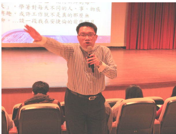
▲謝老師豐富的肢體動作，增添大家對演說的印象。

或許您曾聽過許多令人印象深刻、收穫良多的「好故事」，但您知道如何利用「說故事」來說出影響力嗎？說故事可以增強說服力、提升表達力，我們知道說故事是最受人歡迎的溝通技巧，能讓人印象深刻並採取行動。因此，影響力與說故事技巧間是有著密切關係。