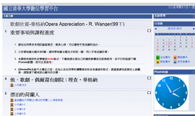
▲可彈性設計屬於自己課程的頁面，營造不同風格。