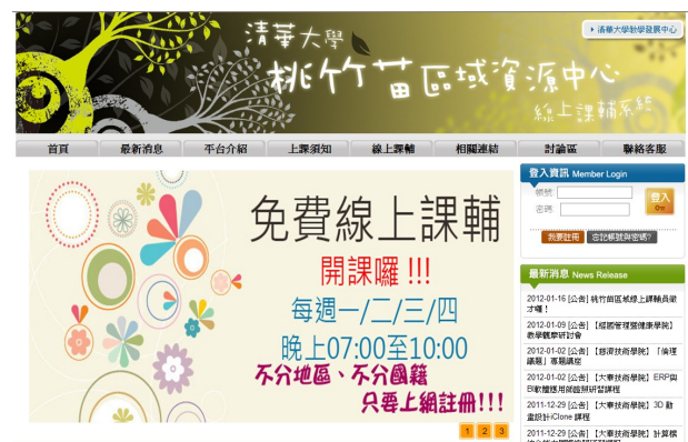
▲凡有課業相關問題，都可到線上課業輔導平台

第二種、欲上一層樓者。 此類同學的英文能力多有一定基礎，並期望可以更精進。此時建議同學們可以多閱讀自己學習領域內較有深度且專業的雜誌或喜歡的小說，例如暢