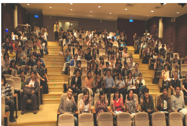
▲演說結束後，謝老師與清大的學生們為他人生第998場講座拍照留念。

放點： 結尾如棒槌，強調自己想要傳達的價值觀與態度。留下思考時間與空白，讓聽眾產生行動。