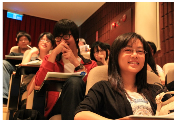
▲謝老師利用說故事發揮其個人影響力，成功的吸引到同學們的目光。

說自己的短處或出糗的例子，比如以「我的國文成績一向很差」做開頭，往往能讓聽眾有親切感；反之，過度吹捧自己容易造成和聽眾的距離。面試時，述說自己失敗的經驗和從中習得的領悟，會讓主管欣賞您的自省能力，留下好印象。