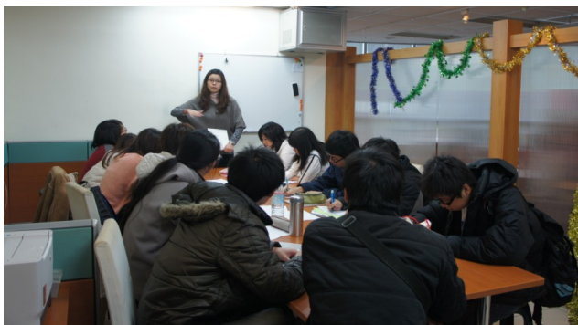
▲由同學擔任導讀人，討論氣氛輕鬆有趣，更能激發組員們的想法，達到事半功倍的效果