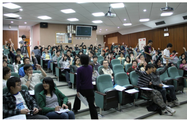
▲演講中，同學們積極的參與活動，表現出清華學子的熱情。

清楚，也就是文章的段落組合是最通順。若段落之間可以替換，那表示文章的邏輯不夠清楚。她指出台灣學生在閱讀時很少從整篇文章的架構去看，很少思考段落間的邏輯關聯，而是打開書就急著從第一個字開始看，但這樣的方式很難有效率地吸收大量資料。因此我們需要翻轉過去的閱讀習慣，學習如何掌握文章的邏輯架構才是閱讀的王道。