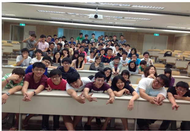
▲學期最後一堂課程，當時已接近晚上 12 點，同學們仍認真地聽完我們講解題目及觀念。