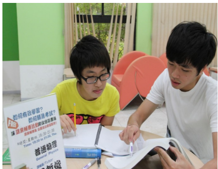
▲圖書館課業輔導員仔細的為同學們解答問題。

為協助同學解答基礎科目（如微積分、普通物理及普通化學等）的課業問題，每學期星期二至星期四晚上於圖書館內進行。它絕對是大一新生的好朋友，善加利