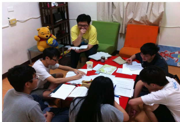
▲拋開課業壓力，三五好友共同組成同好讀書會，利用課餘時間相互交流，增加閱讀廣度。

【歷史所／劉艾靈】我參與教發中心的學生讀書會制度已經邁入第三次了，每次都有不同的收穫。學校讀書會的主題包羅萬象，除了本科知識的精進外，亦有語言、科幻、經典閱讀等讀書會，討論的議題十分多元。雖然我們的讀書會都是與本科系相關，但這三次的讀書會對我來說意義是很不同的，從第一次的「歷史研究與討論」，到第二次「巨龍的蛻變——近現代中國之探