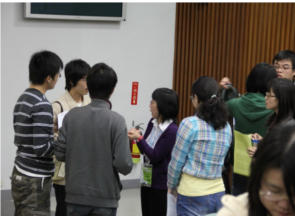
▲演說結束後，同學們向符老師請益關於「有效閱讀」的小撇步。